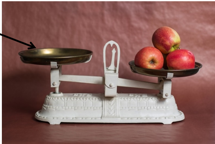
● die Waagschale