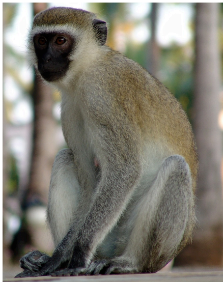
● der Affe