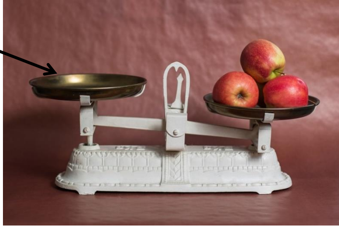
● die Waagschale