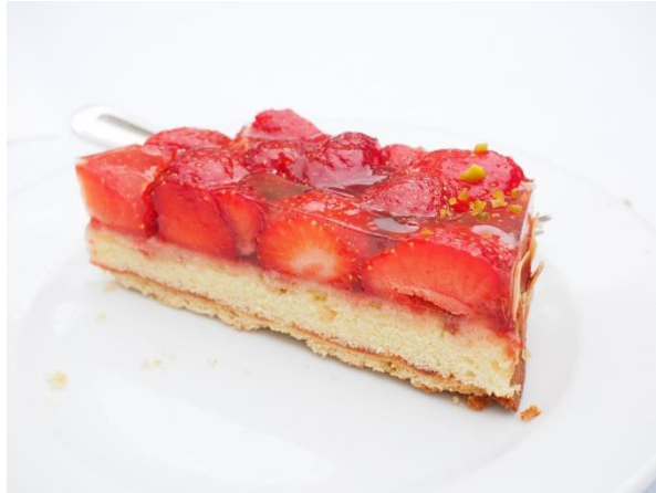
● das Kuchenstück