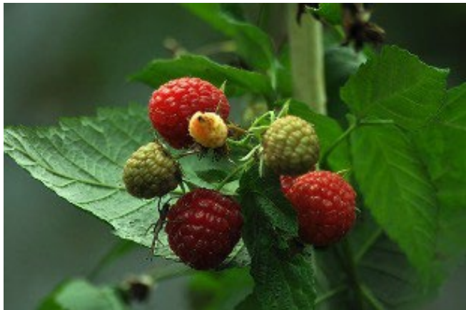
● die Himbeere