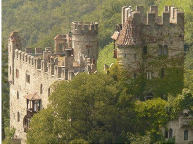
● die Ritterburg