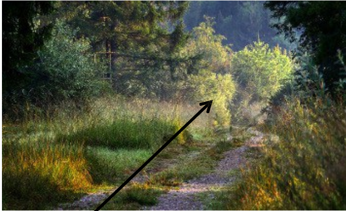
● der Busch