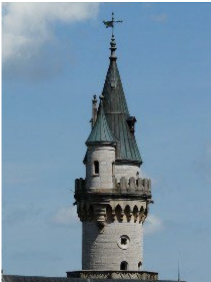
● der Turm