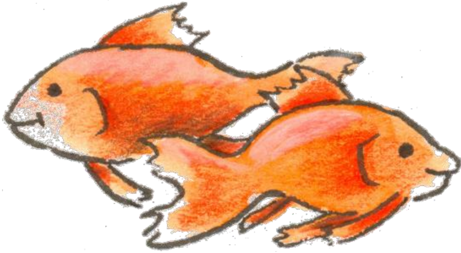
● der Goldfisch die Goldfische