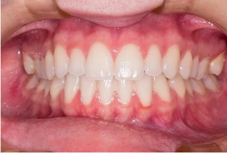
● das Gebiss die Gebisse