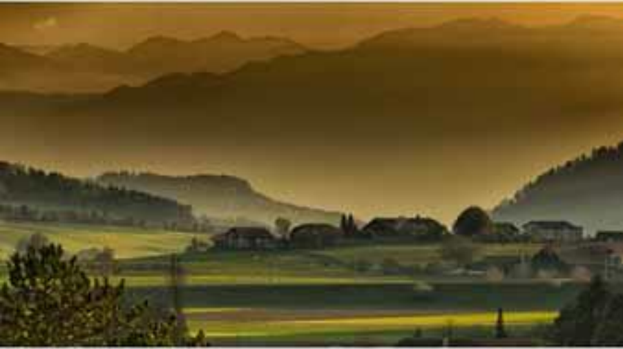
● die Abenddämmerung