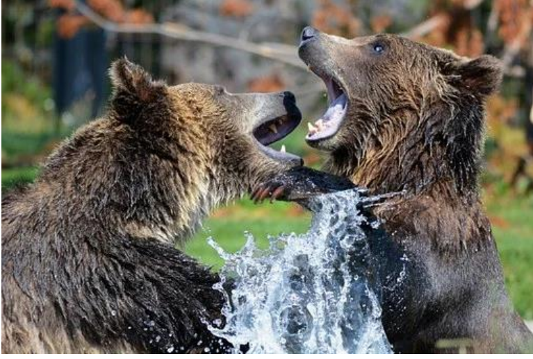
● der Bär die Bären