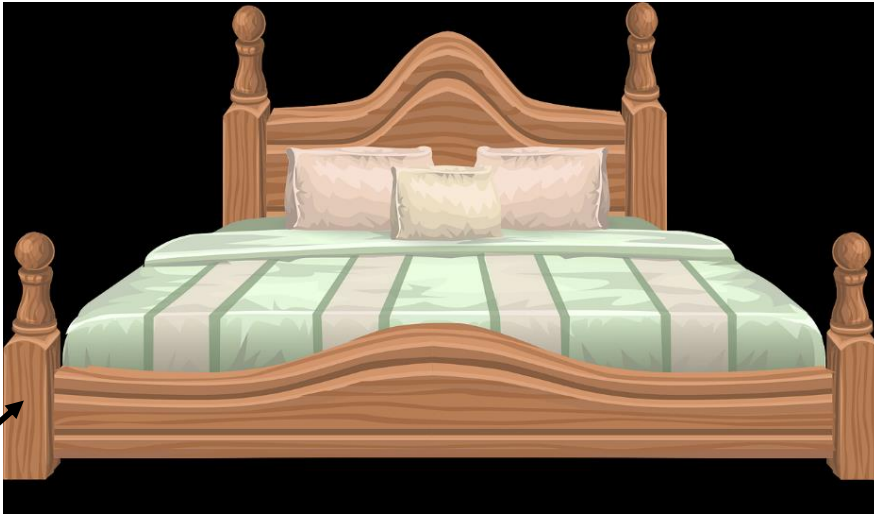
● der Bettposten die Bettposten