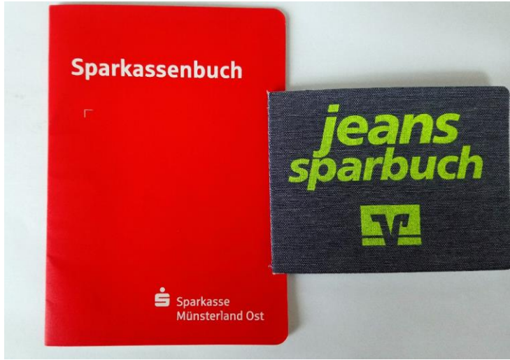
● das Sparbuch die Sparbücher