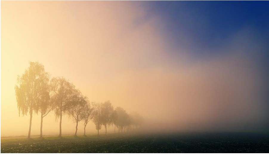
● die Morgendämmerung