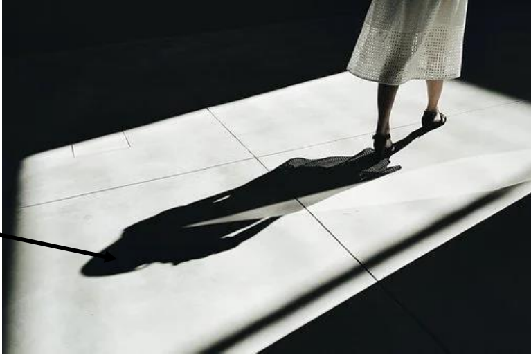
● der Schatten die Schatten