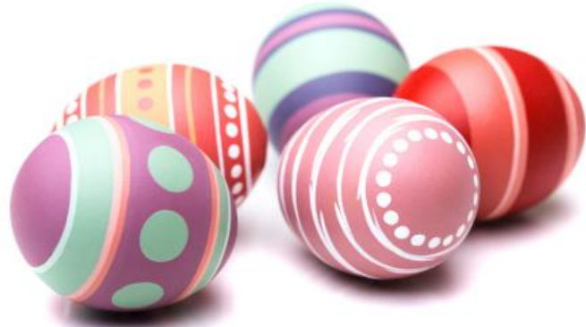
● das Osterei die Ostereier