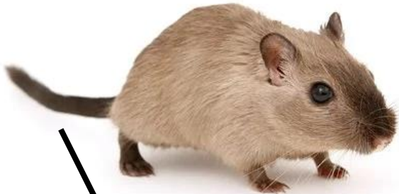
● der Rattenschwanz die Rattenschwänze